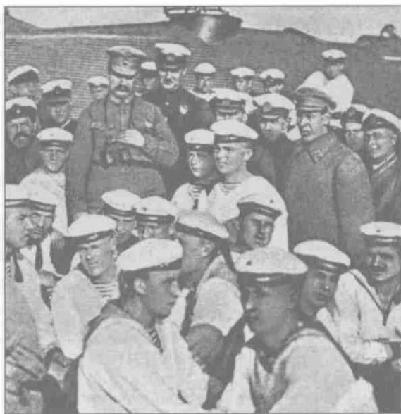
М.В. Фрунзе, А.К. Векман (стоит за ним) и Б.М. Шапошников среди краснофлотцев эсминца «Карл Маркс». 1925 г.