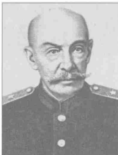
М.Д. Бонч-Бруевич. 1940 г.