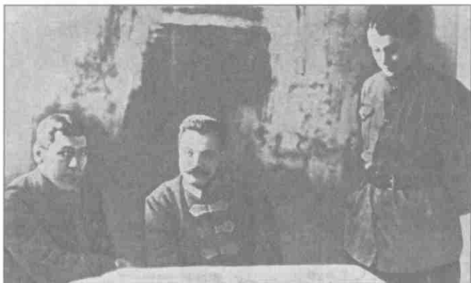
Б.М. Шапошников. М.В. Фрунзе, М.Н. Тухачевский. 1922 г.