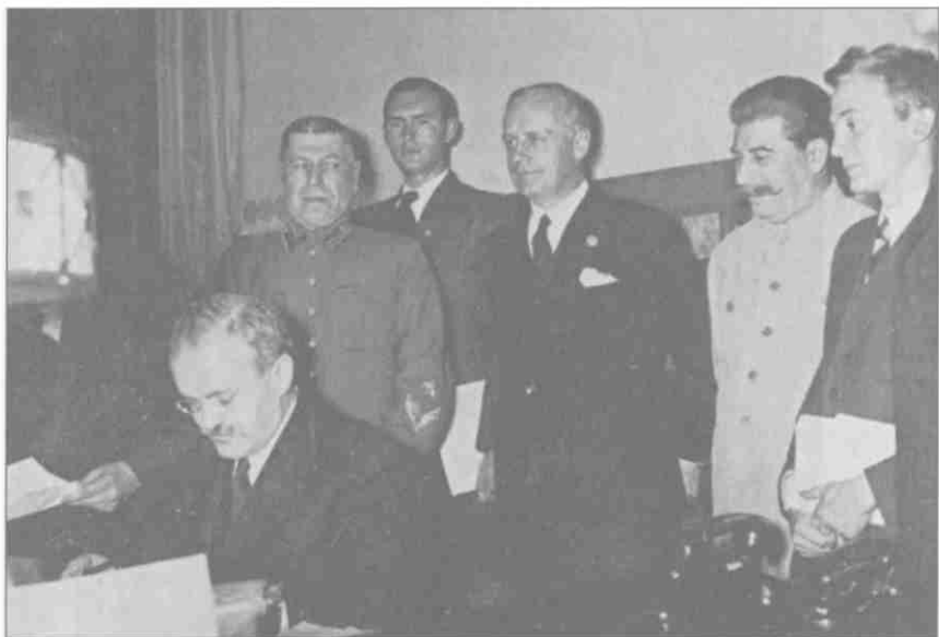
Подписание пакта о ненападении между СССР и Германией (пакт Молотова — Рибентропа) 23 августа 1939 года