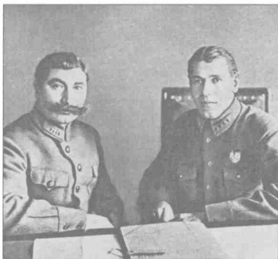
С.М. Буденный и Б.М. Шапошников