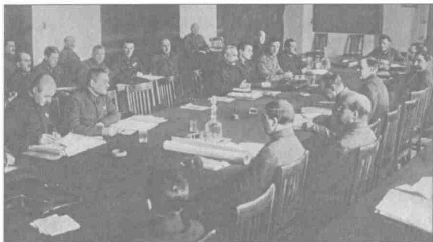
Заседание РВС СССР под председательством К.Е. Ворошилова