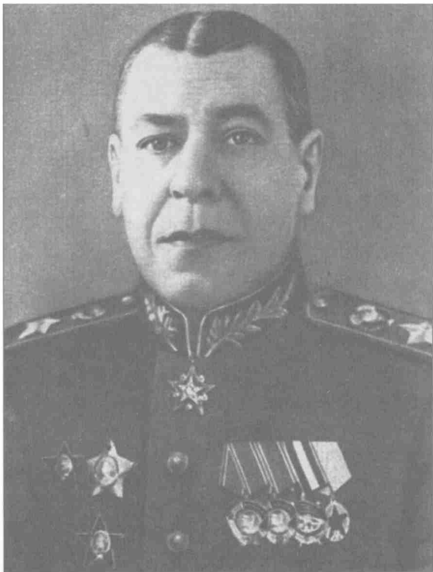
Маршал Советского Союза Борис Михайлович Шапошников