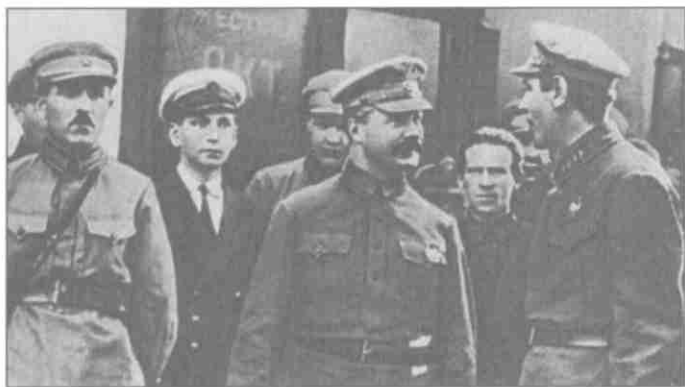
Приезд председателя РВС СССР М.В. Фрунзе в Ленинград. Слева направо: начальник Политуправления округа О.А. Сааков, М.В. Фрунзе, помощник командующего войсками Ленинградского округа Б.М. Шапошников. 1925 г.