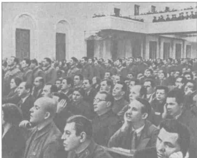
Б.М. Шапошников среди делегатов XVIII съезда ВКП(б). Март 1938 год