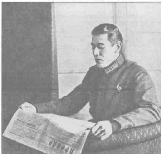
Б.М. Шапошников. 1924 г.