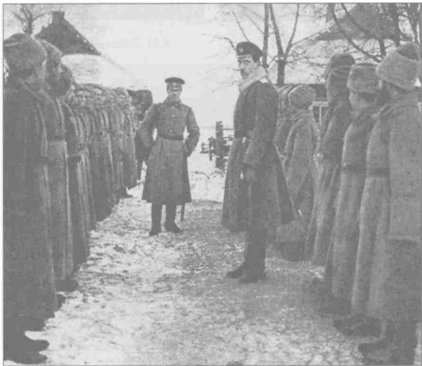
Б.М. Шапошников среди солдат. 1914 г.