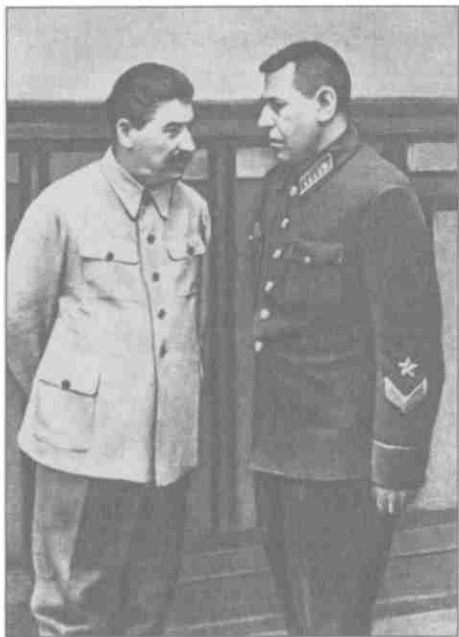
Б.М. Шапошников на докладе у И.В. Сталина. 1938 г.