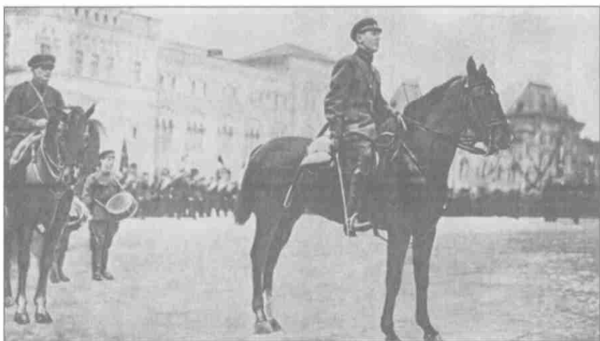
Командующий войсками Московского военного округа Б.М. Шапошников на военном параде в Москве. Май 1928 года