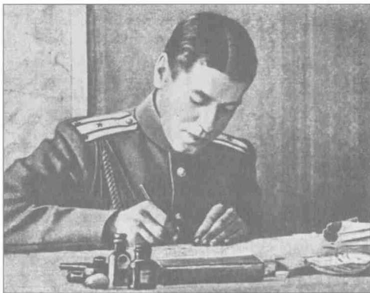
Подполковник Б.М. Шапошников в оперативном отделе Юго-Западного фронта в годы Первой мировой войны