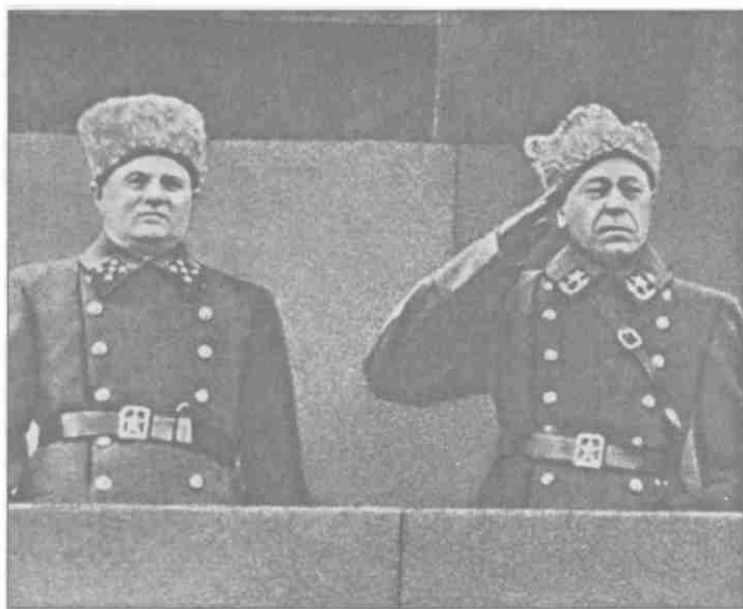
Маршал Советского Союза Б.М. Шапошников и генерал армии К.А. Мерецков на трибуне Мавзолея В.И. Ленина на Красной площади в Москве 7 ноября 1940 года