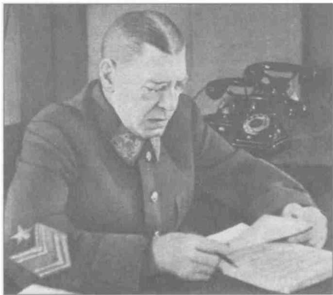
Заместитель наркома обороны СССР Б.М. Шапошников в рабочем кабинете. 1942 г.