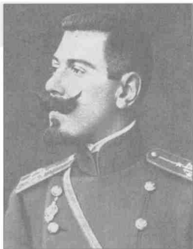
Поручик Б.М. Шапошников. 1907 г.