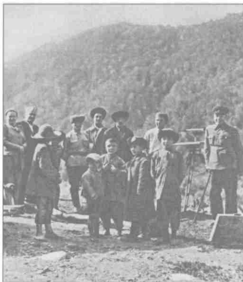
Б.М. Шапошников на отдыхе. Кисловодск, 1940 г.