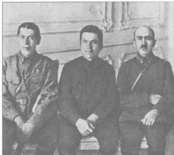
Б.М. Шапошников, С.М. Киров, О.А. Сааков. 1925 г.