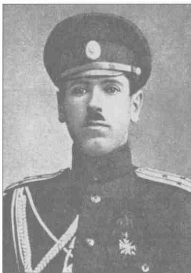
Б.М. Шапошников. 1914 г.